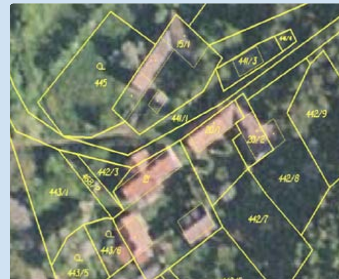
Ortofoto s obrazem katastrální mapy

Údaje o hranicích pozemků je možné zpřesnit dvěma způsoby. Pokud vlastníci mají označeny nesporné hranice pozemků v terénu (zdmi, ploty, hraničními znaky v lomových bodech), zeměměřič tyto hranice zaměří, a po porovnání s dosavadními méně přesnými údaji vyhotoví geometrický plán.